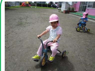
はじめて三輪車に乗ったよ!

子どもたちの熱中症対策、水分補給の為、二学期もしばらくの間、水筒にスポーツドリンク (お茶、お水) を入れて持たせてくださるようお願いいたします。