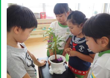
お家でお世話をした ハウセンカが咲いたよ!