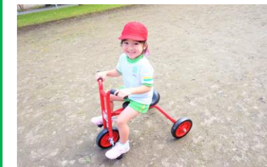
ちょっぴり大きくなった新しい三輪車!