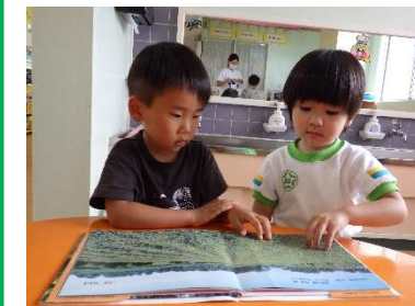
絵本を読むのはたのしいね!