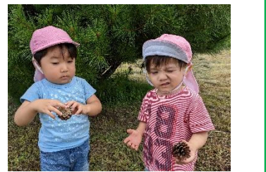
お散歩行って、宝物みつけた!