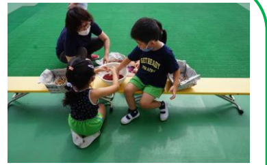
初めての小豆収穫!

子どもたちの熱中症対策、水分補給の為、二学期もしばらくの間、水筒にスポーツドリンク (お茶、お水) を入れて持たせてくださるようお願いいたします。