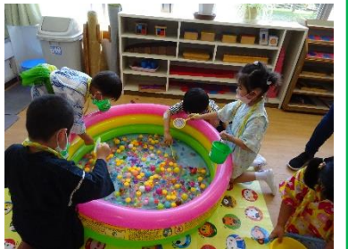
夏祭り! たのしいね!