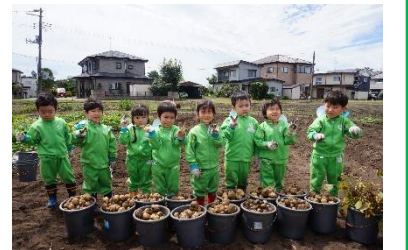
じゃがいも! 大量だあ!!