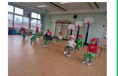
運動あそびではしっかりお話を聞いて楽しみました。