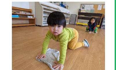
お掃除上手でしょ？