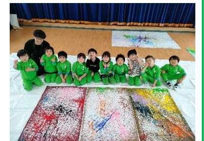
ビー玉コロコロいろんな模様が出来ました。