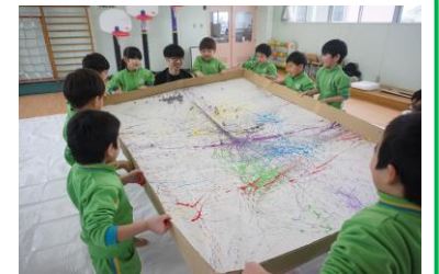
今年は大きな四角で挑戦のビー玉転がし！楽しかったね！